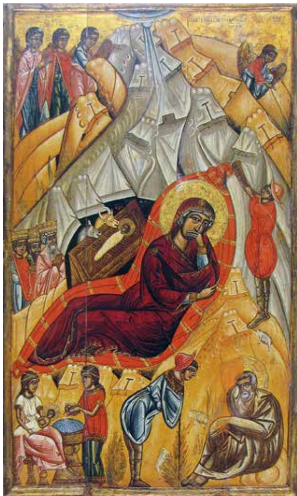
Рис. 6. «Різдво Христове» (фрагмент), середина XVI ст., с. Трушевичі, Львівська обл.

Зображення небесної півсфери має різні форми, часто із трьома чи більше гострими променями. На іконі «Зішестя Св. Духа», середини XVI ст. з Поляни 18 показано момент сходження Св. Духа у вигляді голуба, закомпонованого у небесному колі із зорями. Такого типу зображення неба є характерним для ікон «Богоявлення»; до прикладу: ікона першої половини XVI ст. зі с.Дальова 19 , де символічно представлено Пресвяту Трійцю. На ній вказує небесний сегмент, з якого виходить промінь з зображенням Святого Дуга у вигляді голуба у колі, а далі промінь розділяється ще на три, які опускаються на Спаса. Подібні зображення є на іконах «Різдва Христового» 20 , де небесна півсфера, як алюзія до