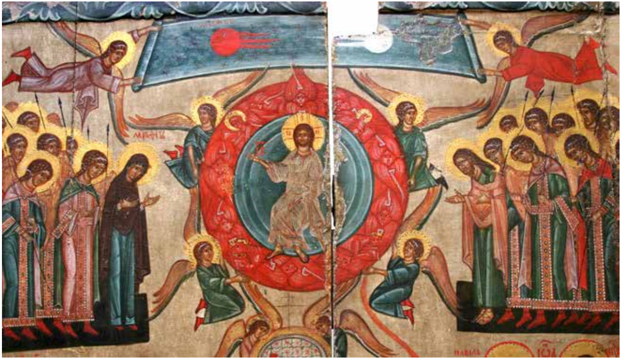
Рис. 9. «Страшний суд» (фрагмент), XV ст., с. Мианець, Львівська обл.

На окрему увагу заслуговують ікони «Страшного суду», оскільки тут астрономічна тематика знайшла своє найширше відображення. Містично-есхатологічний зміст Останнього Божого суду виявляє середньовічні уявлення про кінцеву долю людства, де для праведників приготоване царство небесне, а для грішників – царство диявола. Основою для формування цієї іконографії слугували біблійні та апокрифічні тексти, твори богословів та Отців Церкви, а також, як було досліджено – астральна карта неба 25 .