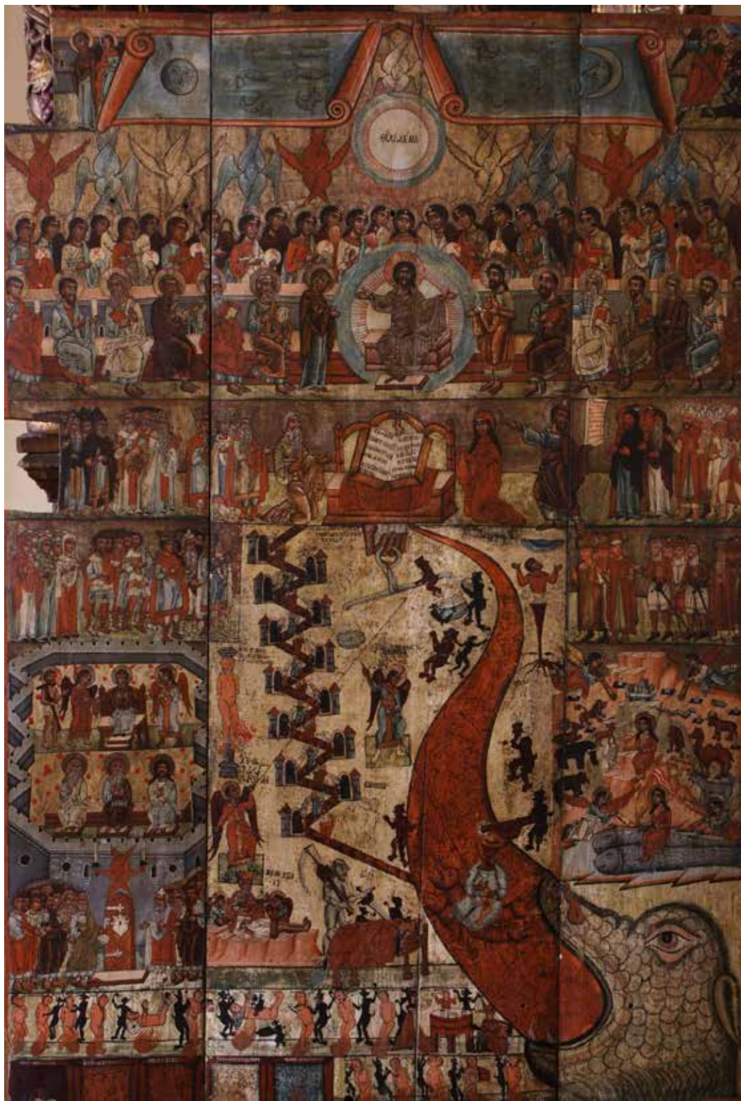
Рис. 10. «Страшний суд», 1560-ті роки, м. Долина, Івано-Франківська обл.