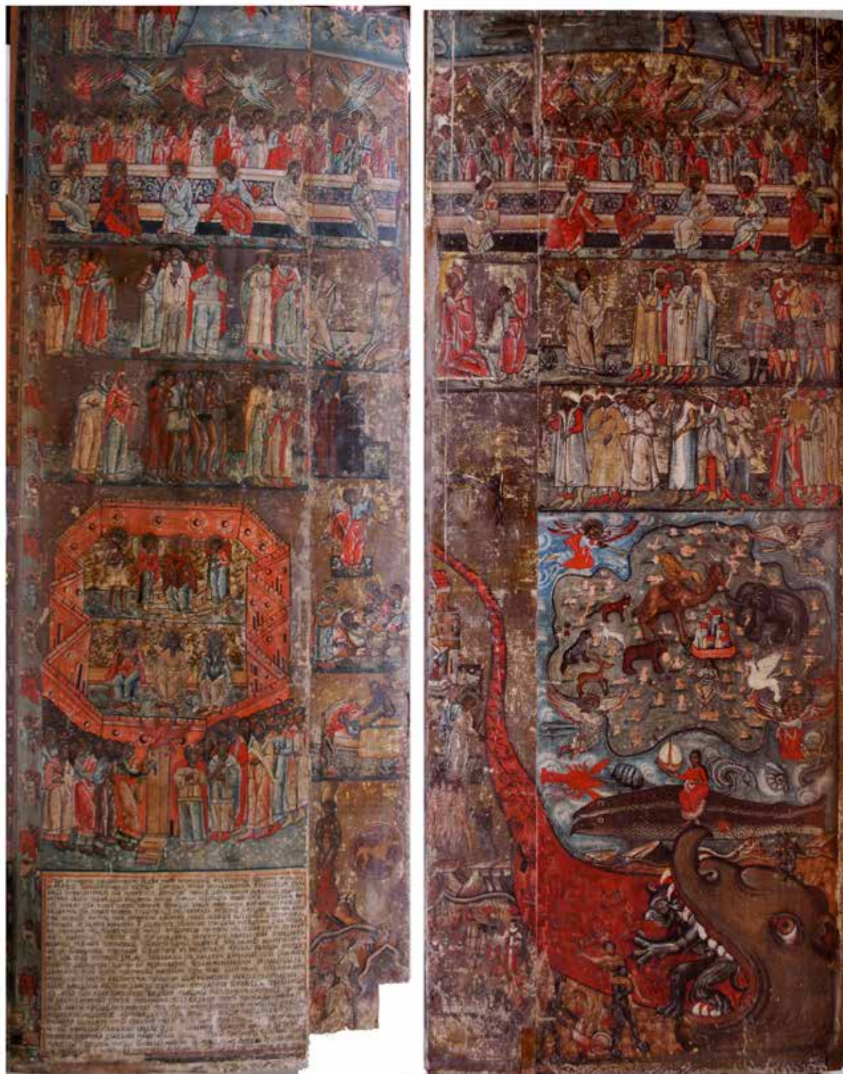
Рис. 12. «Страшний суд», 1587 р., м. Кам'янка-Бузька, Львівська обл.