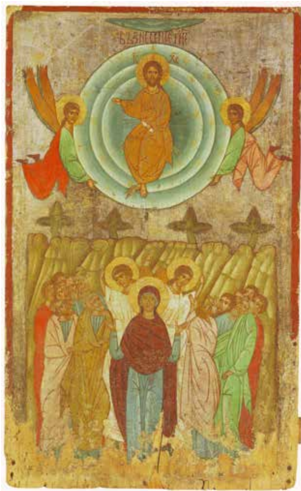
Рис. 5. «Вознесіння», XV ст., с. Підгородці, Львівська обл.

Деяко інший характер зображення має мандорла у сценах «Успіння Богородиці», де Спас являється на похорон Богородиці, щоб забрати її душу до неба. Тут небесна півсфера часто заповнена ангельськими силами, що підсилює небесно-містичний характер цього дійства. Показовою пам'яткою є «Успіння Богородиці» із Сміленька 1547 р. майстра Олексія 10 . Цей тип зображень називають «хмарним Успінням», коли на зооморфного вигляду хмарах чудесним способом прибувають апостоли на похорон Богородиці з різних кінців землі. Вгорі композиції зображена ще одна мандорла, у якій сидить Богородиця на