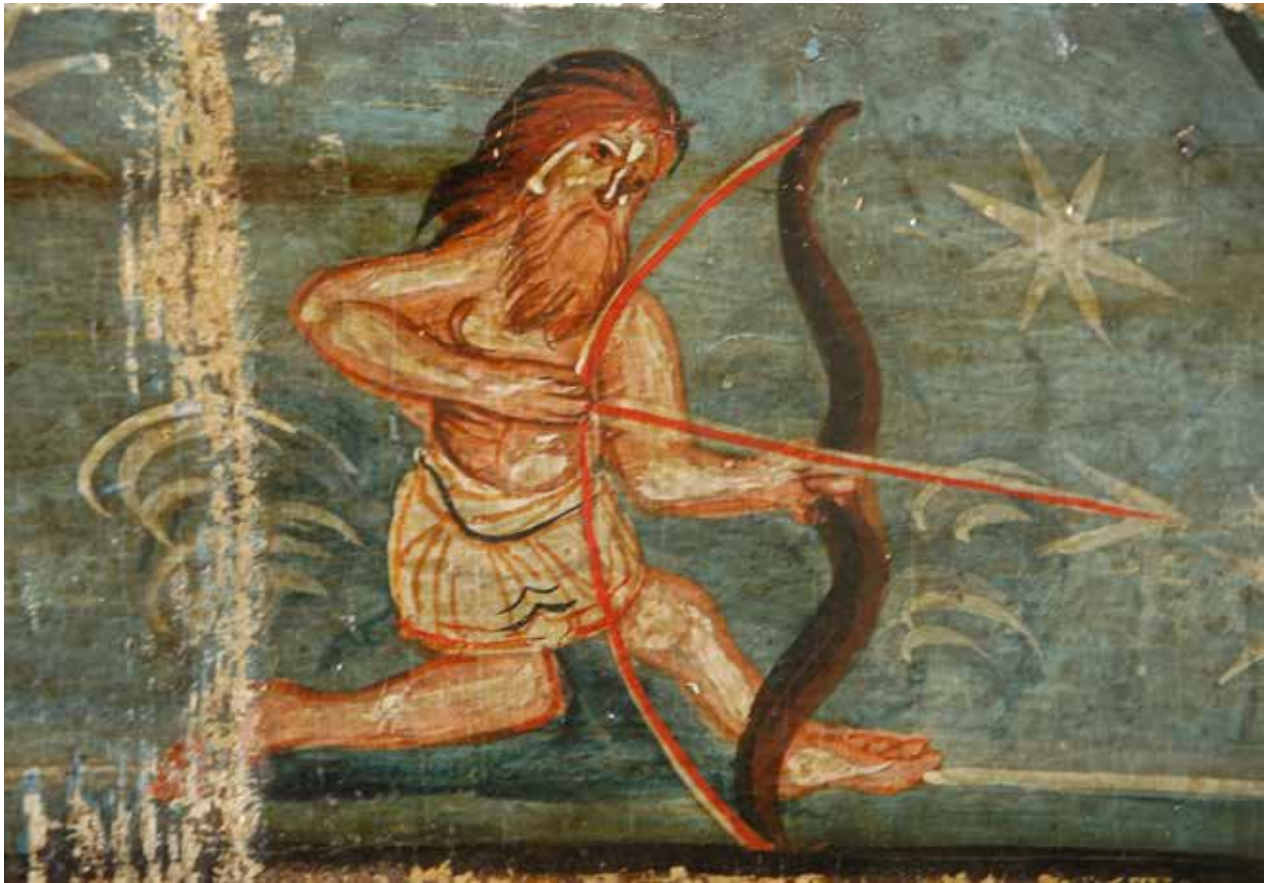
Рис. 13. «Страшний суд» (фрагмент), 1587 р., м. Кам'янка-Бузька, Львівська обл.

тивих». У ранніх зразках вона має вигляд п'ятипелюсткової розетки, котру омивають водойми із персоніфікованими зображеннями водної та земної стихій; пізніше, як на іконі із Долини, Земля має вигляд горбистого масиву з водоймами.