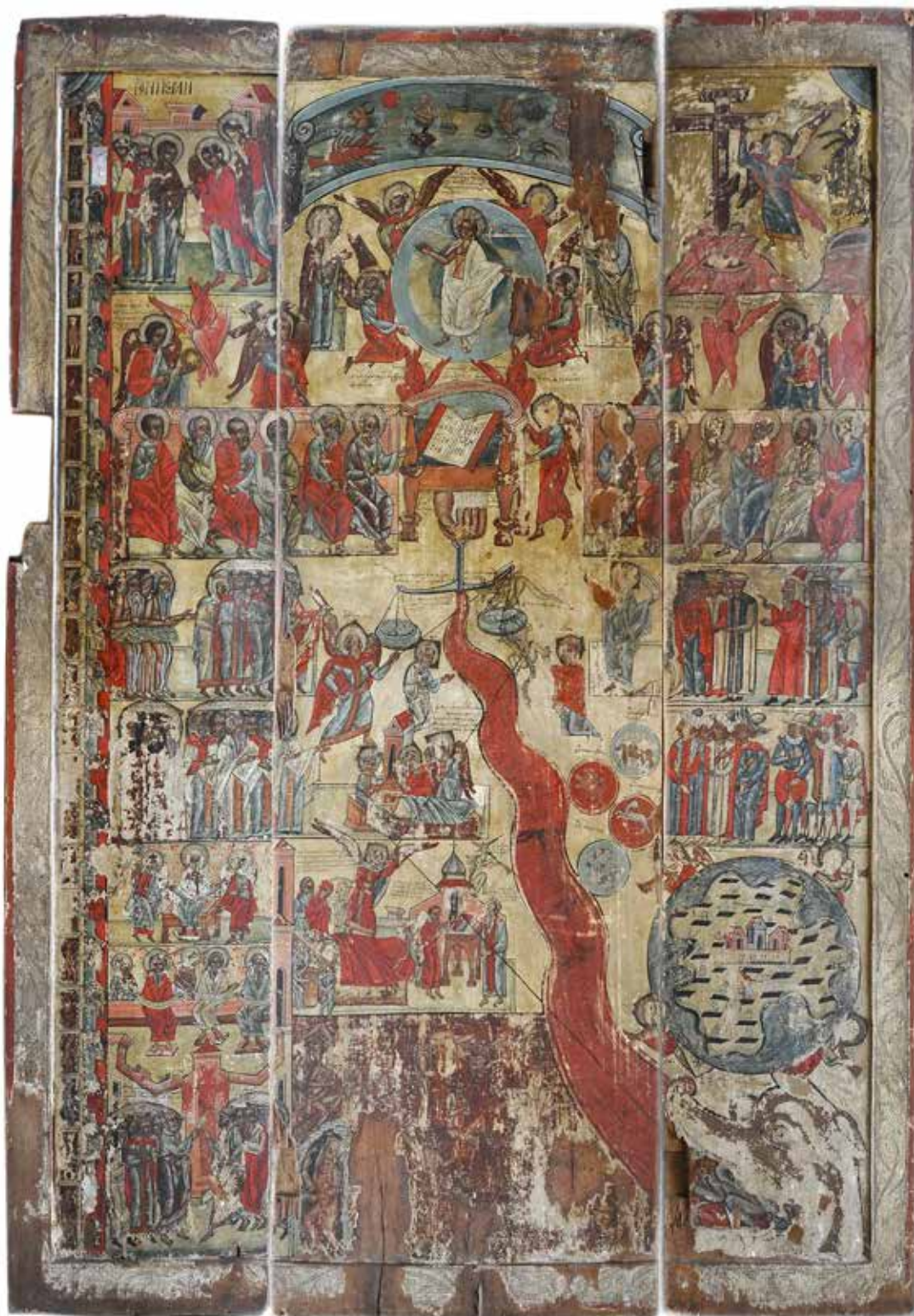
Рис. 14. «Страшний суд», остання чверть XVI ст., с. Раделічі, Львівська обл.