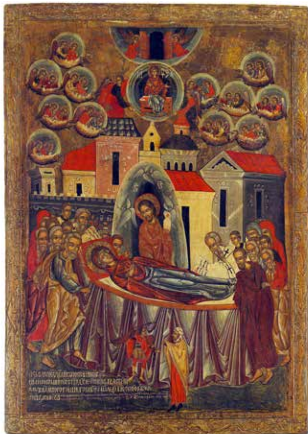
Рис. 4. «Успіння Богородиці», 1547 р. с. Сміленьк, тепер Польща.

мічній поставі прийшов вивести із в'язниці смерті праведні душі.