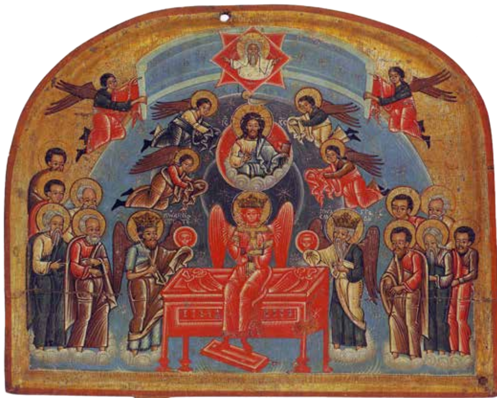
Рис. 1. «Софія Премудрість Божа», друга половина XVI ст., с.Бусовисько, Львівська обл.

роками спостерігаємо пожвавлення дослідницьких процесів у цьому напрямку, зокрема, праці над каталогізацією музейних зібрань 4 . Разом з тим є потреба дослідження іконопису в його найрізноманітніших аспектах, де точкою дотику можуть бути різні наукові дисципліни, в тому числі й астрономія, адже у іконописних схемах знаходимо чимало астрономічних мотивів.