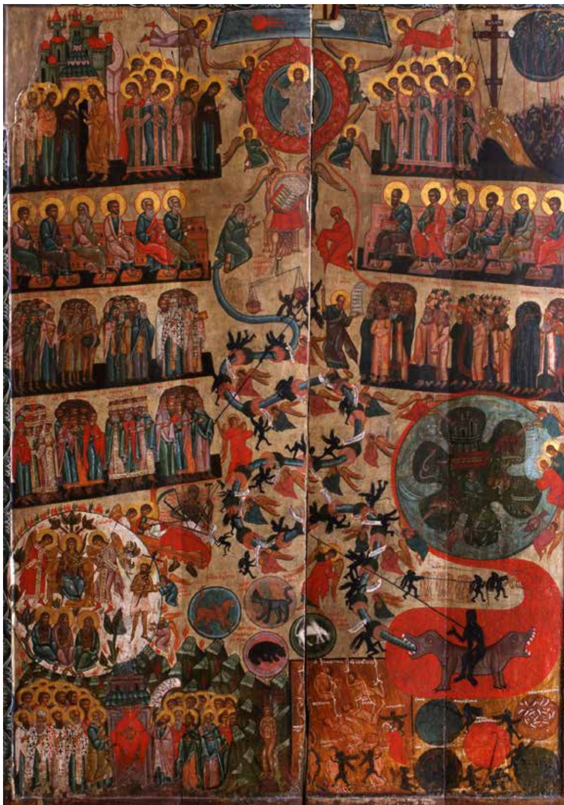
Рис. 8. «Страшний суд», XV ст., с. Мишанець, Львівська обл.