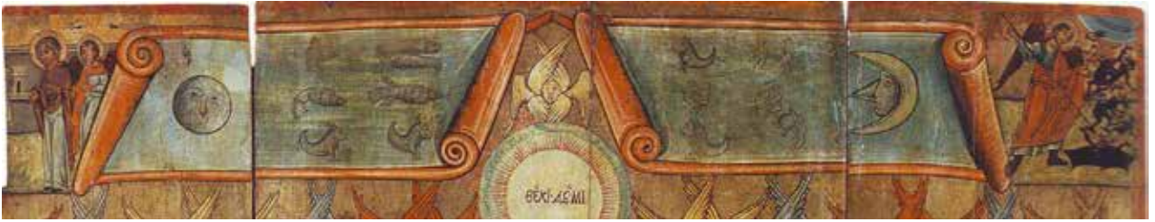
Рис. 11. «Страшний суд» (фрагмент), 1560-ті роки, м. Долина, Івано-Франківська обл.

ської області. Це вже хрестоматійна пам'ятка в історії українського мистецтва. Її автором прийнято вважати майстра Димитрія, звано-го за підписною та датованою 1565 роком іконою «Спас Пантократор» 27 . «Страшний суд» з Долини представляє своєрідну композиційну схему цього іконографічного типу, де традиційна візантійсько-афонська редакція, доповнена новими іконографічними елементами, що визріли під впливом західноєвропейських та балканських зразків. Тут «карта неба» розділена на два окремі сувої, на одному – Сонце, на другому – Місяць; вони містять також по шість знаків зодіаку, зображених схематично. Знаки Скорпіон і Рак тут зображені як риби, а Козеріг та Овен різняться тільки формою рогів. Цікавим є також зображення Терезів у вигляді двох чоловіків, що тримають жердину.