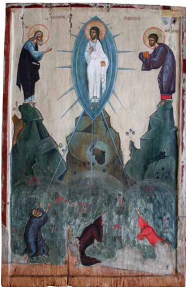
Рис. 2. «Преображення Господнє», XIV ст., с. Бусовисько, Львівська обл.