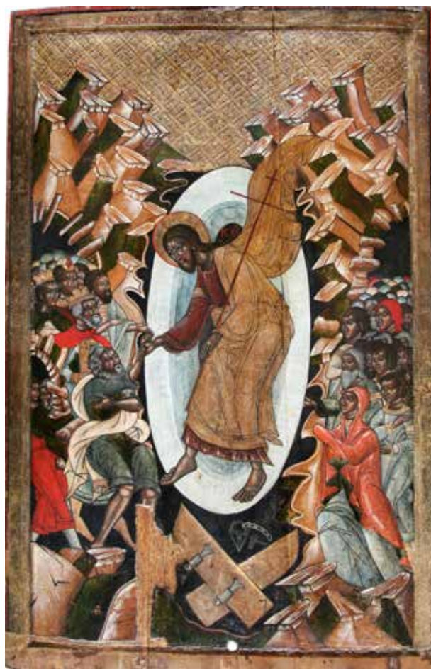
Рис. 3. «Зішестя в ад», перша половина XVI ст., с. Вишенька, Львівська обл.

на землі, Він одночасно залишається частиною небесного царства. Такі зображення є обов'язковими, зокрема, для ікон «Преображення Господнього». Найранішим прикладом цього іконографічного типу в українському іконописі є ікона XIV ст. з Бусовиськ Львівської області. Христос тут представлений в оточенні еліпсоїдної блакитної мандорли, яка складається з концентричних кіл з гострими полюсами. Богословським сенсом цієї біблійної події є те, що Ісус Христос об'явив свою божественну природу перед апостолами на горі Тавор, поставши перед ними в оточенні небесного сйва. Характер-