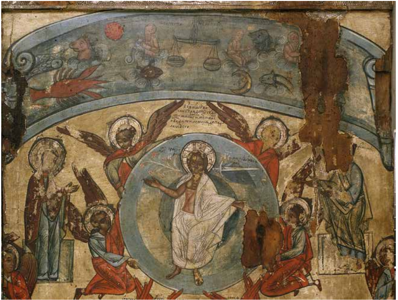
Рис. 15. «Страшний суд» (фрагмент), остання чверть XVI ст., с. Раделичі, Львівська обл.

Львів: Друкарські куншти, 2005. – 96 с.; Гелитович М. Богородиця з Дитям і похвалою: Ікони колекції Національного музею у Львові. – Львів: Свічадо, 2005. – 168 с.; Гелитович М. Святий Миколай з житієм: Ікони XV-XVIII ст. Національного музею у Львові імені Андрея Шептицького. – Львів: Свічадо, 2008. – 152 с.; та інші.